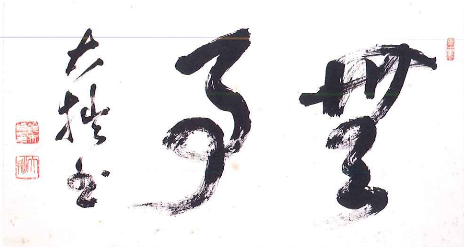
鈴木大拙・書「無事」(鈴木大拙館所蔵)