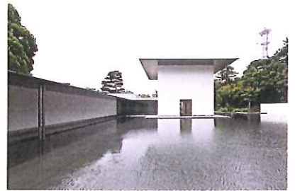
鈴木大拙館 D.T. SUZUKI MUSEUM

〒920-0964 石川県金沢市本多町3丁目4番20号 TEL.076-221-8011 FAX.076-221-8012 http://www.kanazawa-museum.jp/daiset/