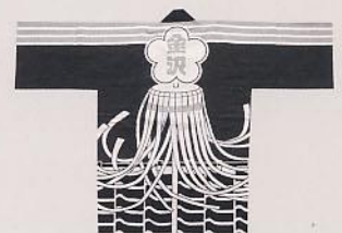
加賀鳶の木遣隊法被

「着物で記念撮影!」10月15日(土)・16日(日)9時半～16時 ※30分単位で要予約