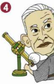
4 木村 榮 Hisashi KIMURA [1870~1943]