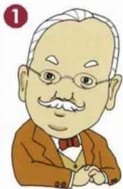
1 高峰 讓吉 Jokichi TAKAMINE [1854~1922]

近代高科技之父。 將澱粉製成藥品，以及將腎上腺素結晶化等， 對醫學學作出貢獻。也盡力於日美兩國友好親善 事業。