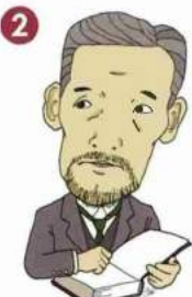
2 櫻井 錠二 Jeji SAKURAI [1858~1939]

近代高科技之父。 將澱粉製成藥品，以及將腎上腺素結晶化等， 對醫學學作出貢獻。也盡力於日美兩國友好親善 事業。