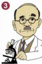
3 藤井 健次郎 Kenjiro FUJII [1866~1952]