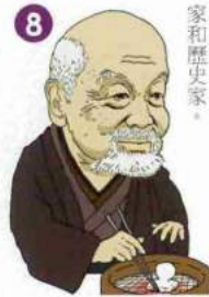
8 三宅 雪嶺 Setsurei MIYAKE [1860~1945]

在日本國內，最且以個人名義籌 辦社會福利事業的第一人。 終其一生奉獻於社會福利活動。