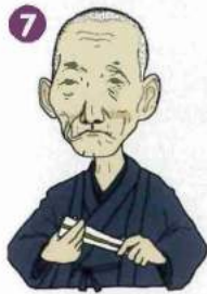
7 小野 太三郎 Tasaburo ONO [1840~1912]

在日本國內，最且以個人名義籌 辦社會福利事業的第一人。 終其一生奉獻於社會福利活動。