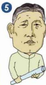
5 八田 與一 Yoichi HATTA [1886~1942]

在台灣建造了東洋最大規模的水庫。營造出又 長又大的農業灌溉水渠。因此開拓出廣闊的農 耕地。滋潤了台灣大地的八田與一被稱為「嘉 南大圳之父」。