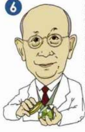
6 飯盛 里安 Satoyasu IIMORI [1885~1982]

在台灣建造了東洋最大規模的水庫。營造出又 長又大的農業灌溉水渠。因此開拓出廣闊的農 耕地。滋潤了台灣大地的八田與一被稱為「嘉 南大圳之父」。