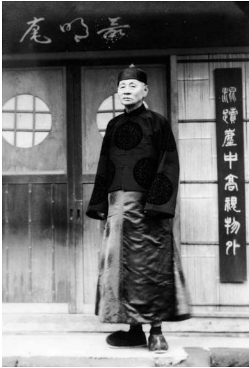
鎌倉最明庵(自宅)前にて