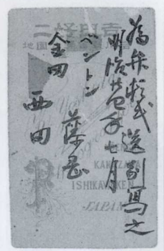
ベントン氏送別写真 明治24年(1891)7月 左より西田、山本良吉、藤岡作太郎、ベントン。ベントンは四高の英語教師を勤めていた。