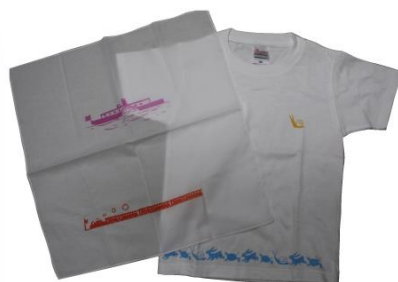
写真は昨年のハンカチとTシャツです