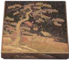
תיבת כתיבה מלקה Makie עם עיצוב של עגור ועץ אורן.