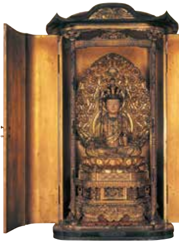
פסל עץ מכוסה בעלי זהב של האלה קאנון עם 11 פנים