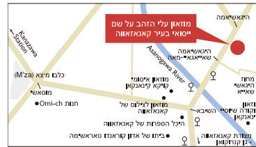
תחנת האוטובוס האשיבאשו

* אין חנייה במוזאון. יש להשתמש בתחבורה ציבורית