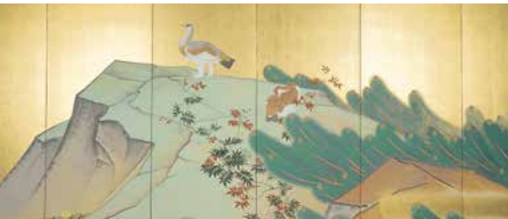
하쿠산 라이초도 병풍(우측부분)