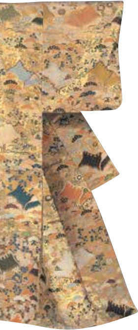
전통가면극 노 의상 암자초화무늬당직(부분)

본관은 금박 제조 도구, 공정견본 및 미술공예 작품을 소장하고 있습니다. 미술공예 작품은 금 병풍을 비롯해 회화와 가가마키에 등의 칠공예, 가가상감으로 대표되는 금속공예, 금실을 이용한 염직, 도자기, 칠보유리, 조각, 서예, 기타 금박공예 등 다방면에 걸쳐 있습니다.