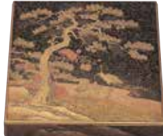
소나무와 학 무늬 마키에 베틀상자