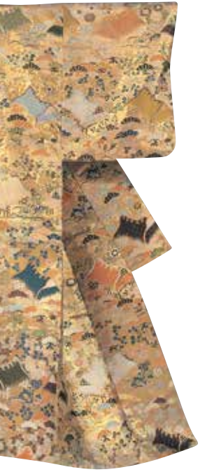
能劇服裝庵與草花紋樣唐織（部分）