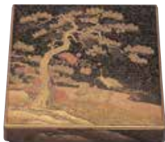
松與鶴蒔繪硯箱 五十嵐隨雨