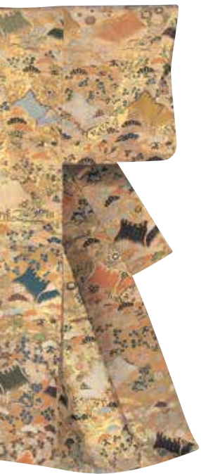
能劇服裝庵與草花紋樣唐織（部分）