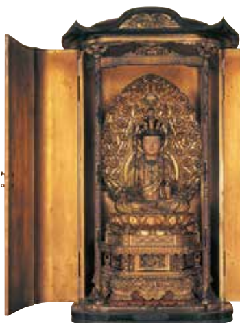
截金十一面觀音像（部分）