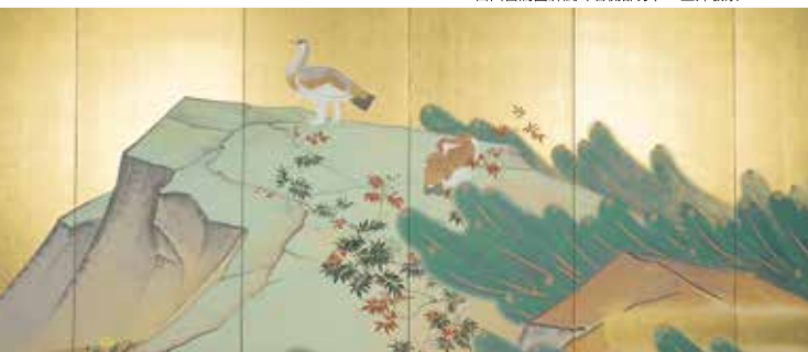
白山雷鳥圖屏風（右側部分） 玉井敬泉