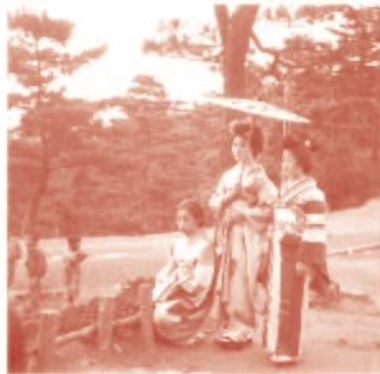
中判フィルム (ネガ)