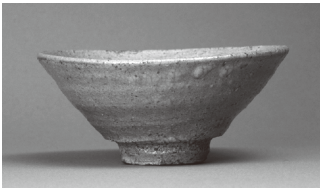
金沢市指定文化財 青井戸茶碗 銘雲井 李朝