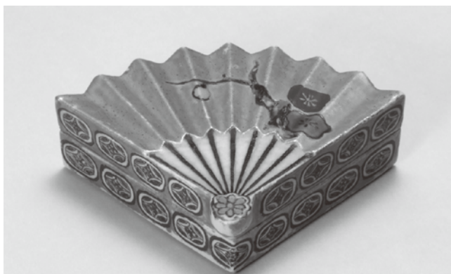
金沢市指定文化財 扇形梅の絵香合 青木木米 江戸