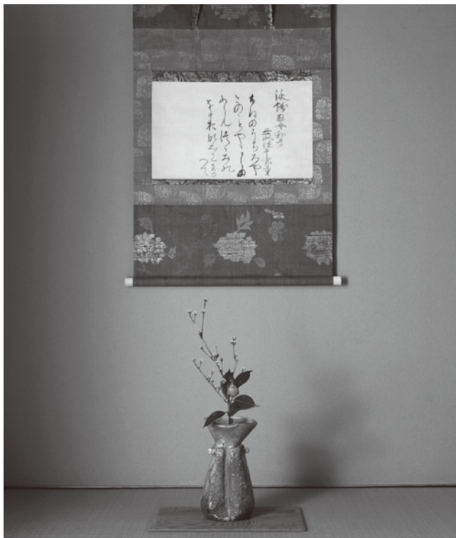
★重要文化財 懐紙 平家重 鎌倉 (★印の作品は期間限定) 古伊賀耳付花生 桃山