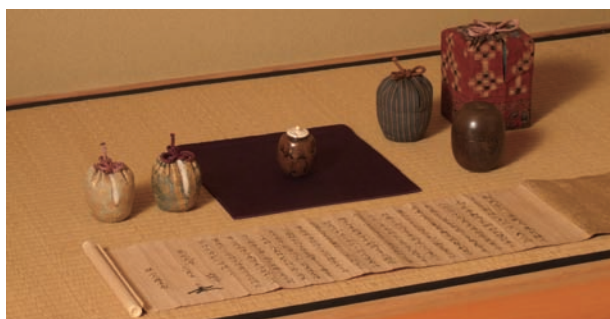
金沢市指定文化財 唐物肩衝茶入 利休小肩衝 南宋～元