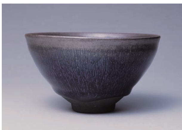
★特別公開 禾目天目茶碗 南宋 那谷寺所蔵 ★印の作品の展示は4/26～5/25に限定