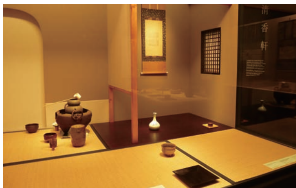
パリ展示風景 成巽閣茶室清香軒復元