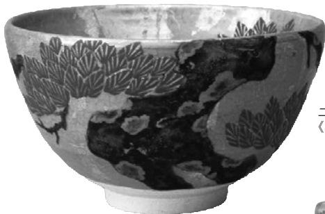
二代 中村梅山 《松之絵茶碗》1990年