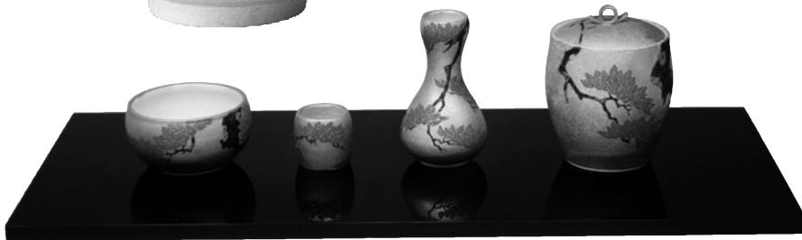
二代 中村梅山《松之絵皆具》1990年