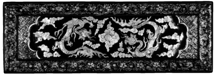
《青貝竜文軸盒》16-17世紀