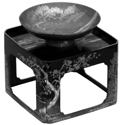
五十嵐随甫《松竹梅鶴蒔絵大盃・盃台》 江戸・明治 19世紀

併せて、新春の茶席にふさわしい茶道具も展示します。 禅語や季節の絵画の掛軸、めでたい意匠の茶碗や棗、 酒器など“新春感”のある茶道具の展示をとおして、初釜 の雰囲気どうぞお楽しみください。