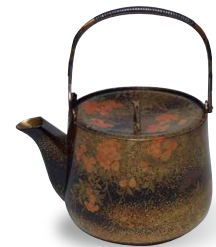
Pichet à saké à motif de plantes et de fleurs Ogaki Shokun (20e siècle)