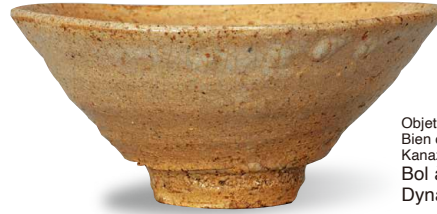
Objet d'art important / Bien culturel désigné par la Ville de Kanazawa Bol à thé appelé « Kumoi » Dynastie Joseon (16 siècle)