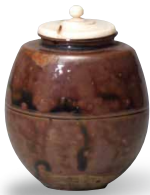
Bien culturel de la Ville de Kanazawa Boîte à thé appelée « Rikyu-kokatatsuki » Dynasties Song-Ming méridionales (13-15 siècles)