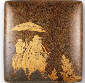
Objet d'art important / Bien culturel désigné par le département d'Ishikawa Boîte pour une pierre à encre, à motif d'Occidentaux Période Momoyama (16 siècle)