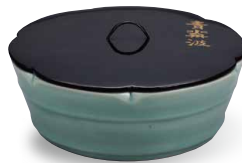
Objet d'art important / Bien culturel désigné par la Ville de Kanazawa Récipient à eau connu sous le nom de Seigaha (vague océanique) Céramique de Longquan (12e-13e siècles)