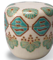
Boîte à thé à décor sur glaçure de chrysanthèmes et paulownias Nonomura Ninsei (17e siècle)