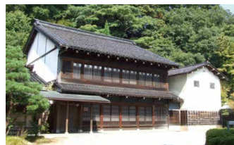
Ancienne maison de la famille Nakamura

Des expositions à thèmes mettant en valeur les caractéristiques de ces arts ont été tenues au musée.