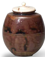
Bene culturale designato dal Municipio di Kanazawa Contenitore per il tè chiamato "Rikyu-kokatatsuki", di tipo Katatsuki (XIII-XV secolo)