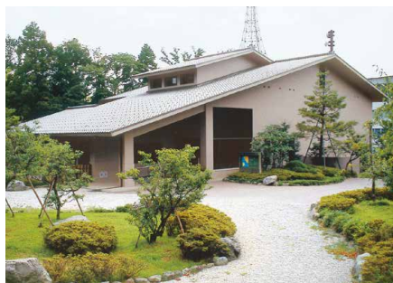
■ Vista esterna del Museo

Che ne dite di gustare una tazza di tè verde, ammirando il giardino?