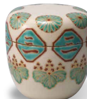
Barattolo da tè con decorazioni a soprasmalto di crisantemi e paulownia Nonomura Ninsei (XVII secolo)