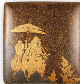
Importante oggetto d'arte/Bene culturale designato dal municipio di Kanazawa Scatola per calligrafia con rappresentazione di popoli occidentali in maki-e (XVI secolo)