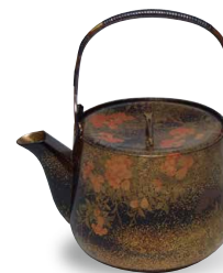
Brocca per il sakè con piante e fiori Ogaki Shokun (XX secolo)