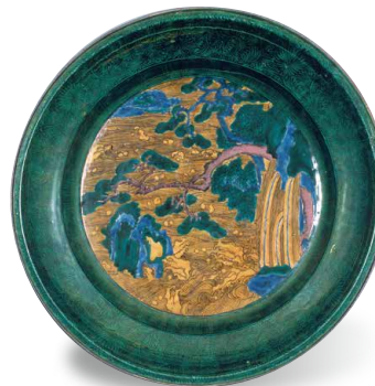
Ciotola piatta con motivo paesaggistico in stile Aote (XVII secolo)