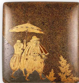
重要美术品·金泽市指定重点文物 南蛮人泥金画砚盒 桃山时代(16世纪)