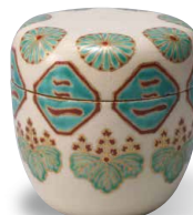
彩绘菊桐纹茶器 野野村仁清 江户(17世纪)