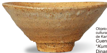
Objeto de arte importante y propiedad cultural designada por la ciudad de Kanazawa Cuenco para té conocido como "Kumoi", tipo Ao-ido Dinastía Joseon (siglo XVI)