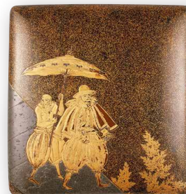
Objeto de arte importante / Propiedad cultural designada por la prefectura de Ishikawa Caja para escribir decorada con occidentales en maki-e Periodo Momoyama (siglo XVI)