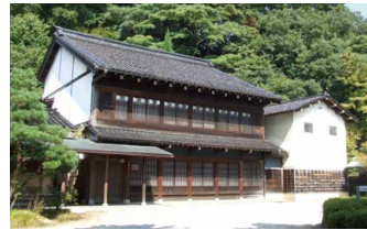
Antigua Residencia Nakamura