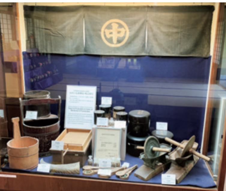
BENE CULTURALE MATERIALE NAZIONALE

Si tratta di strumenti che venivano utilizzati per la produzione e la vendita di medicinali nella Farmacia Nakaya, attiva fin dal periodo del clan Kaga. Sono materiali di inestimabile valore per comprendere la situazione attuale della produzione tradizionale e della vendita dei medicinali, nella città di Kanazawa.