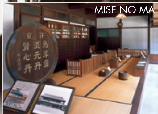
MISE NO MA