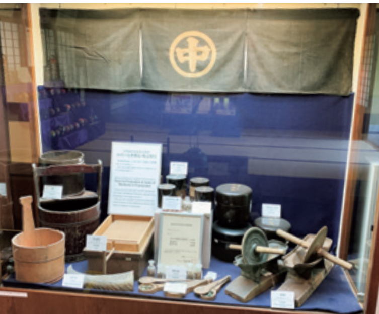
PATRIMONIO CULTURAL NACIONAL TANGIBLE

Utensilios que estaban en venta, o que se utilizaban en la fabricación de medicinas, en la farmacia Nakaya, representando la ciudad de Kanazawa durante el periodo del clan de Kaga. Es un material de gran valor que nos permite conocer la venta y la fabricación tradicional de medicinas en Kanazawa.