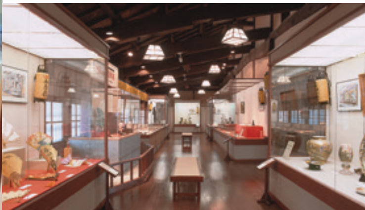
SALA DE EXHIBICIÓN

En las salas de exhibición en la segunda planta, con la colaboración de 60 establecimientos tradicionales miembros de la Shinise Hyakunenkai de Kanazawa (la asociación de mercaderes tradicionales), se exhiben utensilios y otros objetos cotidianos transmitidos durante generaciones que pertenecían a diversas tiendas de mercaderes.