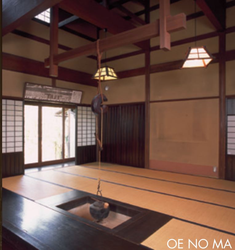
OE NO MA