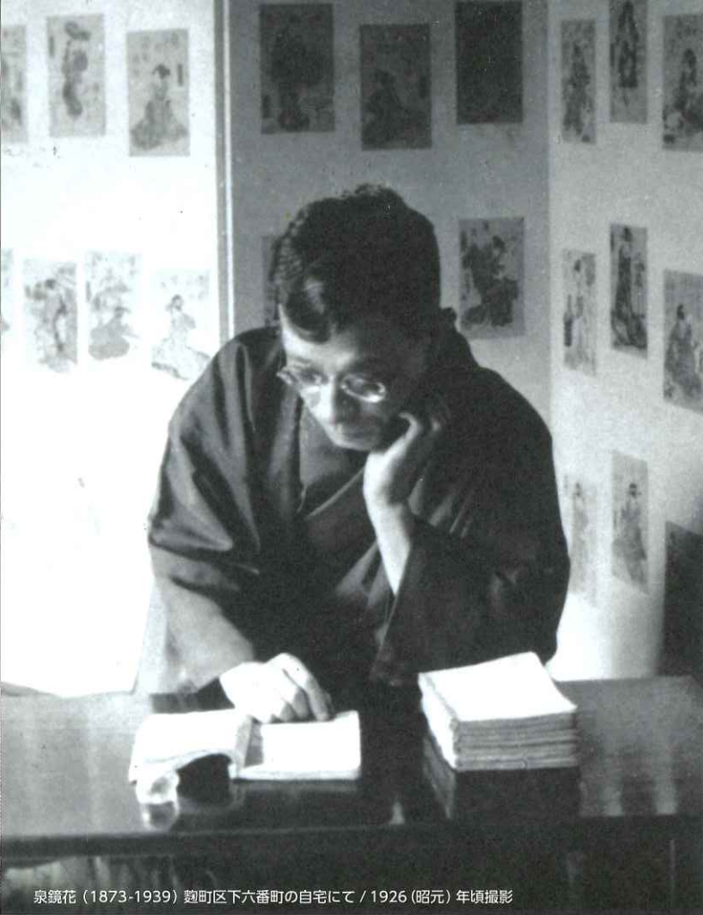
泉鏡花 (1873-1939) 麴町区下六番町の自宅にて / 1926 (昭元) 年頃撮影