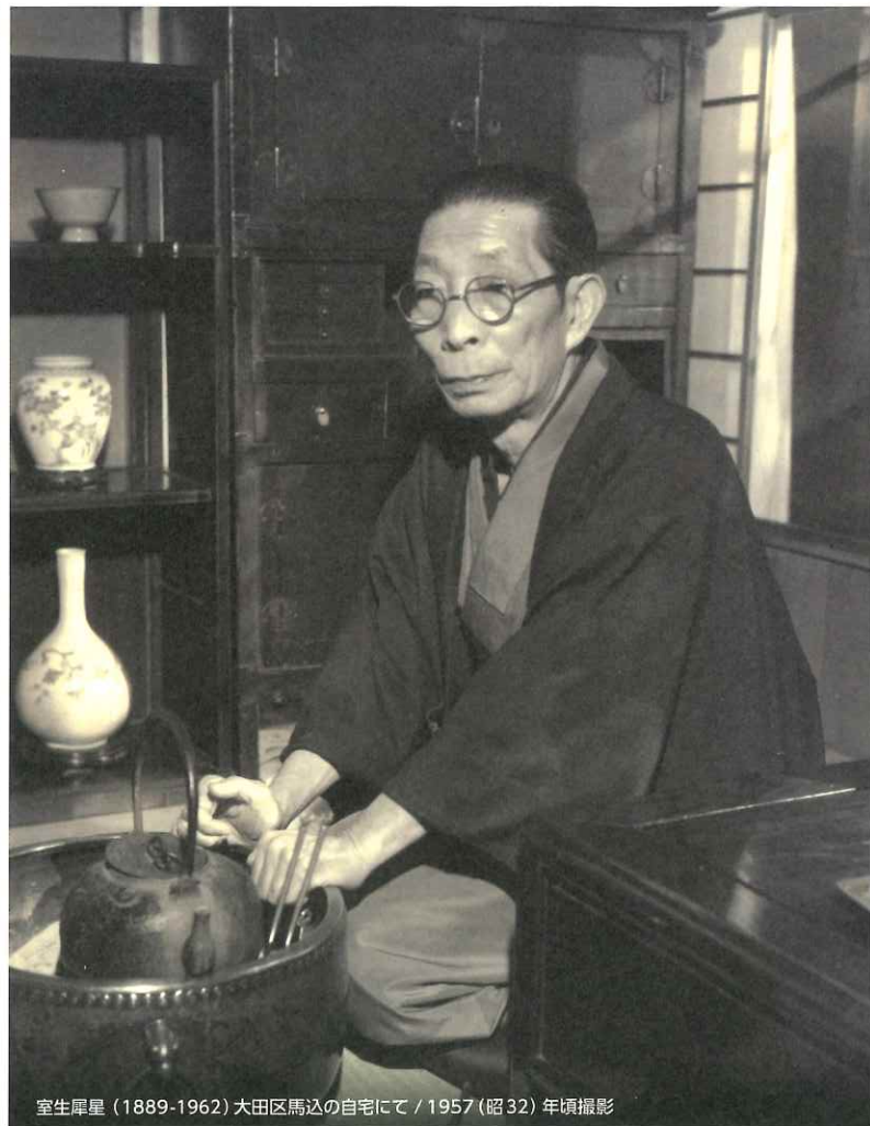
室生犀星 (1889-1962) 大田区馬込の自宅にて / 1957 (昭32) 年頃撮影