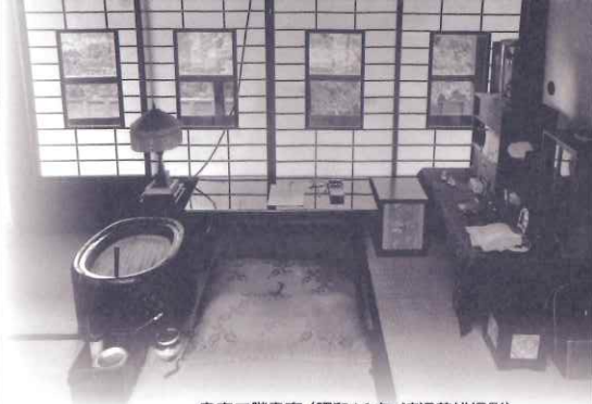
泉家二階書斎(昭和16年)

展示 10/14(土)~12/17(日) 企画展 大和し思ほゆ一文学に探す雅のすがた 常設展内特別展示 泉鏡花生誕150年記念展ミニ [開催中~12/28(木)] 常設展内特別展示 波津彬子「あらあらかしこ」原画展(仮) [10/21(土)~12/17(日)]