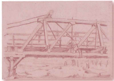
竹久不二彦、「建設中の沙流川橋」、鉛筆/紙、昭和27~31年、当館蔵