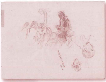
竹久不二彦、下絵「春をいそぐ娘たち」(北海道新聞)、鉛筆、墨/紙、昭和24年(1949)、当館蔵