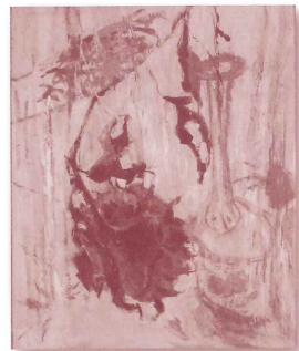
竹久不二彦、「枯れたヒマワリ」油彩/キャンバス、昭和末~平成初期、当館蔵