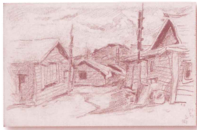
竹久不二彦、「門別市街(スケッチブック25/58)」、鉛筆・色鉛筆/紙、昭和20年(1945)、当館蔵