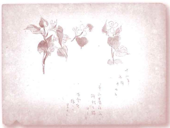
竹久不二彦、「どくだみ」、鉛筆、水彩/紙、昭和18年(1943)、当館蔵

なお、本展覧会の会期中には、コーナー展示「木版摺りによる夢二の装幀と和文具」を開催し、夢二装幀本や和文具の摺り本など54点を貼り込んだスクラップブック(竹久家コレクション)とその関連作品を展示します。