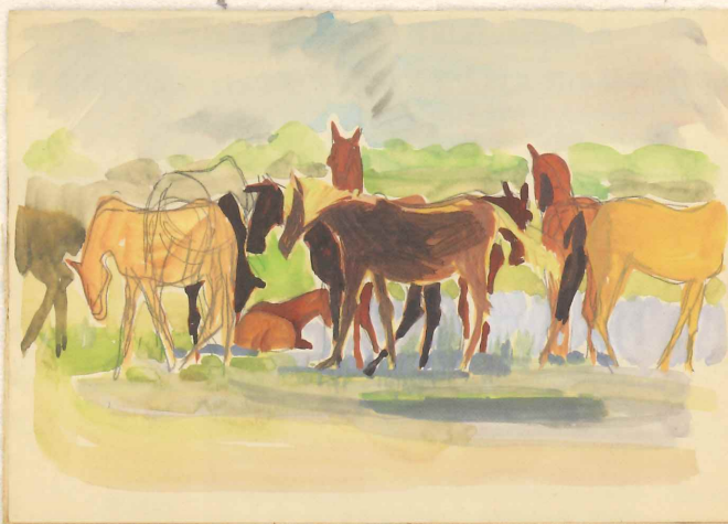
竹久不二彦「馬」鉛筆・水彩/紙、昭和20年(1945)頃、当館蔵