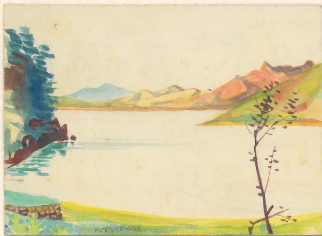
竹久不二彦「岳麓西湖畔風景」鉛筆・水彩/紙、昭和11年(1936)、当館蔵