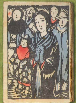
竹久夢二装幀・徳田秋聲著 「路傍の花」大正8年(1919)、 徳田秋聲記念館蔵