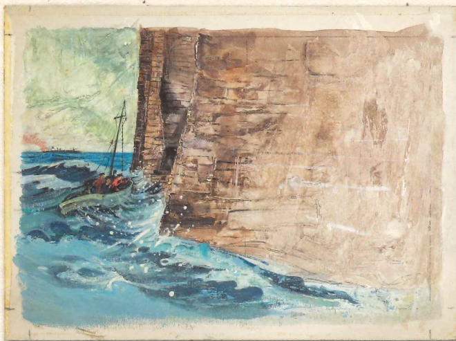
竹久不二彦「ハヤカワ・ノヴェルズ「北海の墓場」下絵」、油彩/板、昭和46年(1971)、当館蔵